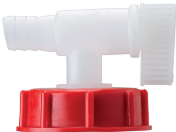
Art. Nr.: 7924

Geeignet für alle LIQUI MOLY Öle im 20 l Gebinde mit Entlüftung und Gewinde DIN 61.