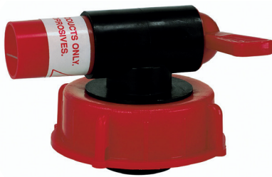
Art. Nr.: 3322

Auslaufhahn mit Entlüftung für Kanister und Fässer. Eignet sich für ein einfaches, sauberes und schnelles Umfüllen von Flüssigkeiten. Geeignet für Gewindegröße DIN 51. Z.B. bei der Verarbeitung der folgenden Produkte: