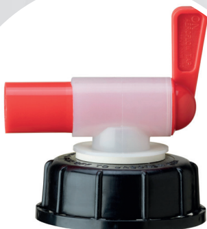
Art. Nr.: 29076

Geeignet für alle Bremsflüssigkeiten* von LIQUI MOLY im 20 l Gebinde.